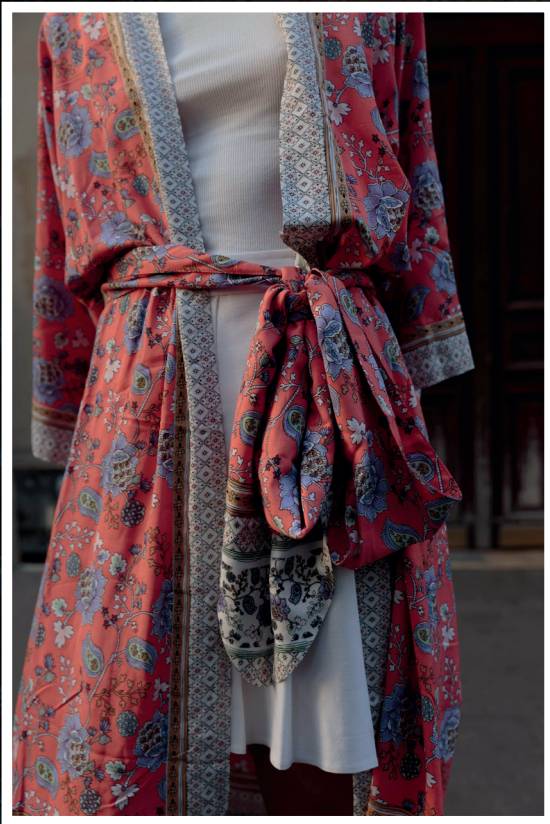
China Gypsy Land Corail