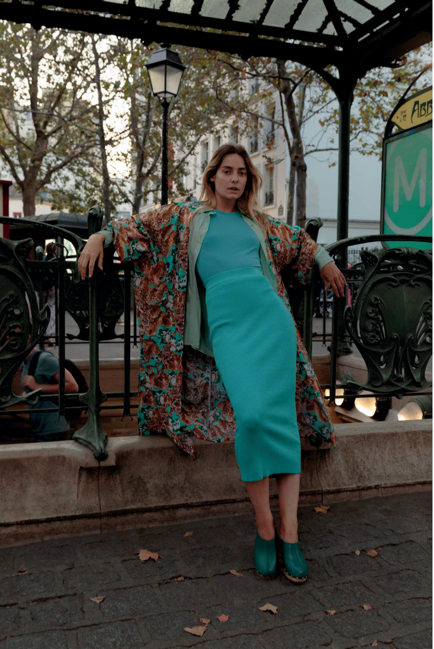
China Tiger Turquoise