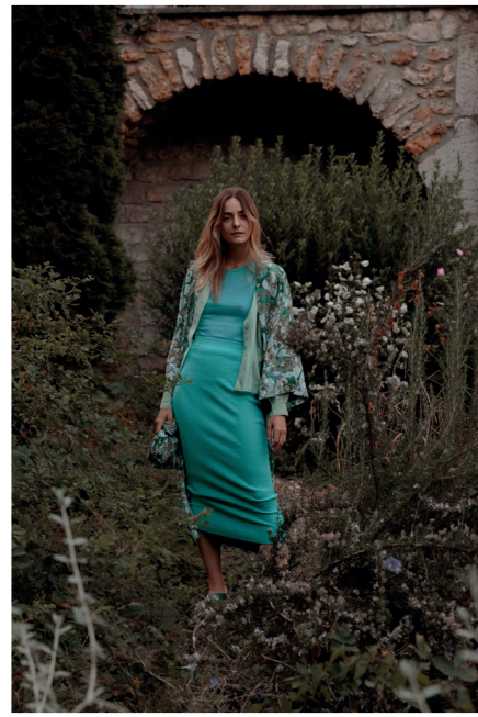
China Tokyo Green