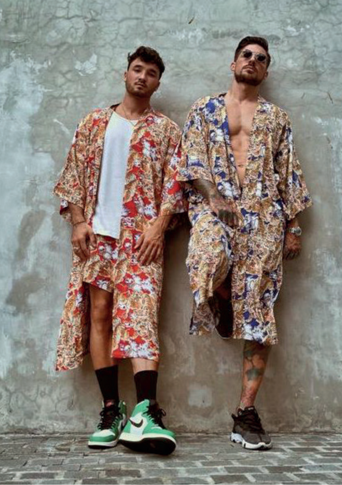
China Tiger Red & Navy